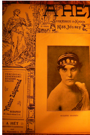
A Hét egy címoldala (1909)

„Most tíz éve fohászokodtam neki annak a vállalkozásnak, hogy heti lapot alapítok olyan közönségnek, amely még nincs, olyan írókkal, akik még csak lesznek. A hetilapra ugyan nem volt szüksége senkinek, de szükségem volt rá nekem. Adó-alapot kellett teremtenem, mert a poézis nem adó-alap. Elmentem tehát és beálltam lapszerkesztőnek a világ legélhetősebb kiadójához és egy csapásra két adó-alapot is teremtettem, lett belőlem szerkesztőkiadó. Három hétre rá homlokon csókolt az adókiivetőbizottság feje és felavatott harmadosztályú kereseti adót fizető honpolgárrá a végrehajók nagy megilletődésére, akikkel azóta állandóan szoros barátságot kötöttem. (...) Tőkepénzes leszek pénz nélkül; rabszolgatartó lesz a nevem és amint én szidtam eddig a kiadókat, azonképpen fognak majd szidni engemet.” 4