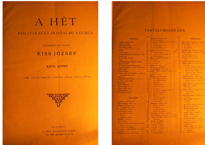
A Hét tartalomjegyzéke (1903)

Mivel már több helyen is utaltam arra, milyen rovatok voltak egy-egy számban, foglaljuk most össze, hogyan is nézett ki A Hét . Ha valaki napjainkban akarja ezt a lapot a kezébe venni, egy fél évfolyamnyi anyagot tud megtekinteni egyszerre, ennyi számot kötöttek ugyanis egy kötetbe. Nagy előnye ezeknek a köteteknek, hogy az első számot megelőzően találunk egy tartalomjegyzéket (néha nem találjuk, de ez nyilván annak köszönhető, hogy a legtöbb évfolyam két világháborút is túlélte), melyet a szerkesztők küldtek előfizetőik számára, ahogy ez egy, a Heti Postában szereplő, az olvasóknak szóló üzenetből is kiderül: „Mai számunkhoz csatolva veszik olvasóink a félévi tartalomjegyzéket.” 12